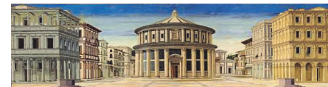
la Città ideale