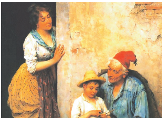
E. De Blaas "La pipa del nonno" 1908—particolare